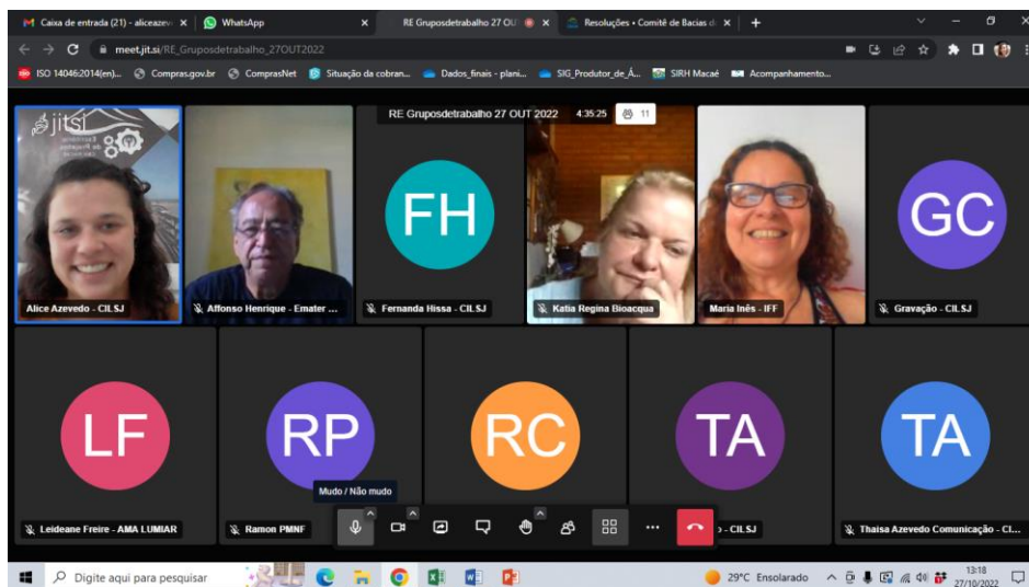
Figura 1. Registro da Reunião GT PSA em 27 de outubro de 2022.